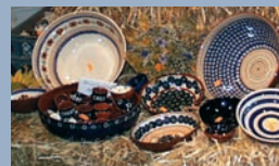
Das bekannte Bunzlauer Muster wird noch in zwei Fredelsloher Töpfereien hergestellt