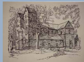
Fredelsloh bietet Freunden zeitgenössischer Kunst regelmäßig wechselnde Ausstellungen, zudem zahlreiche weitere kulturelle Veranstaltungen wie Lesungen und Konzerte