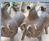
KERAMIK.UM, Mittelalterbrand: Gießgefäße in Tierform

Kirche, Rose und Tonkrug kennzeichnen das historische Wappen von Fredelsloh. Sie stehen auch heute noch stellvertretend für die kunsthandwerkliche Tradition, das kulturelle Erbe sowie die reizvolle Umgebung des Ortes.