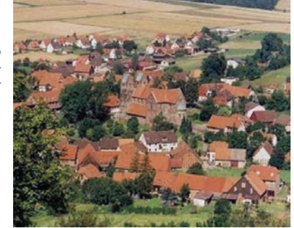
Fredelsloh: idyllisch gelegen, mit dem "Flair" hübscher Fachwerkhäuser