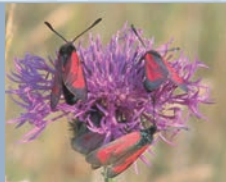
Begegnungen am Wegesrand

Kirche, Rose und Tonkrug kennzeichnen das historische Wappen von Fredelsloh. Sie stehen auch heute noch stellvertretend für die kunsthandwerkliche Tradition, das kulturelle Erbe sowie die reizvolle Umgebung des Ortes.