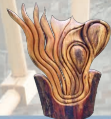
Baumkunst: Die Vielfalt der einheimischen Hölzer erleben. Gewöhnliches in ungewohnter Form, Objekte zum Nutzen und Genießen.