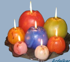
Apfelkerzen: durchgefärbt & handgeformt