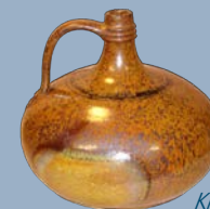
Krug, Holzofenbrand, Kunsttöpferei Klett